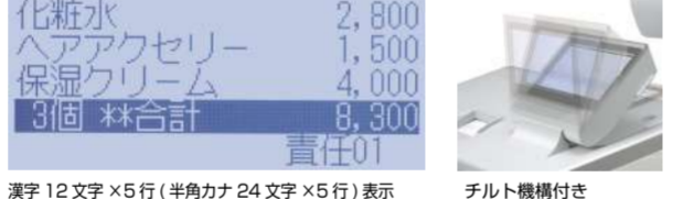
漢字 12 文字 × 5 行 (半角カナ 24 文字 × 5 行) 表示 チルト機構付き

◆漢字対応 5 行表示の大型液晶を搭載 オペレータ用表示部には、チルト機構付で角度調整も可能な大型液晶を採用。 文字の視認性の高いフォントを採用しております。