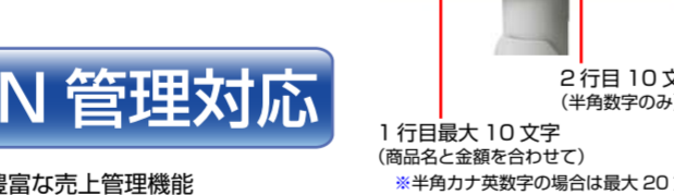
2 行目 10 文字 (半角数字のみ) 1 行目最大 10 文字 (商品名と金額を合わせて) ※半角カナ・英数字の場合は最大 20 文字

◆漢字対応 2 行表示カスタムディスプレイ お客様への表示部に漢字対応・2 行表示ポップアップ回転式のディスプレイを採用。 見やすい確度に調整でき、明るい液晶表示により、文字もはっきりと確認できます。